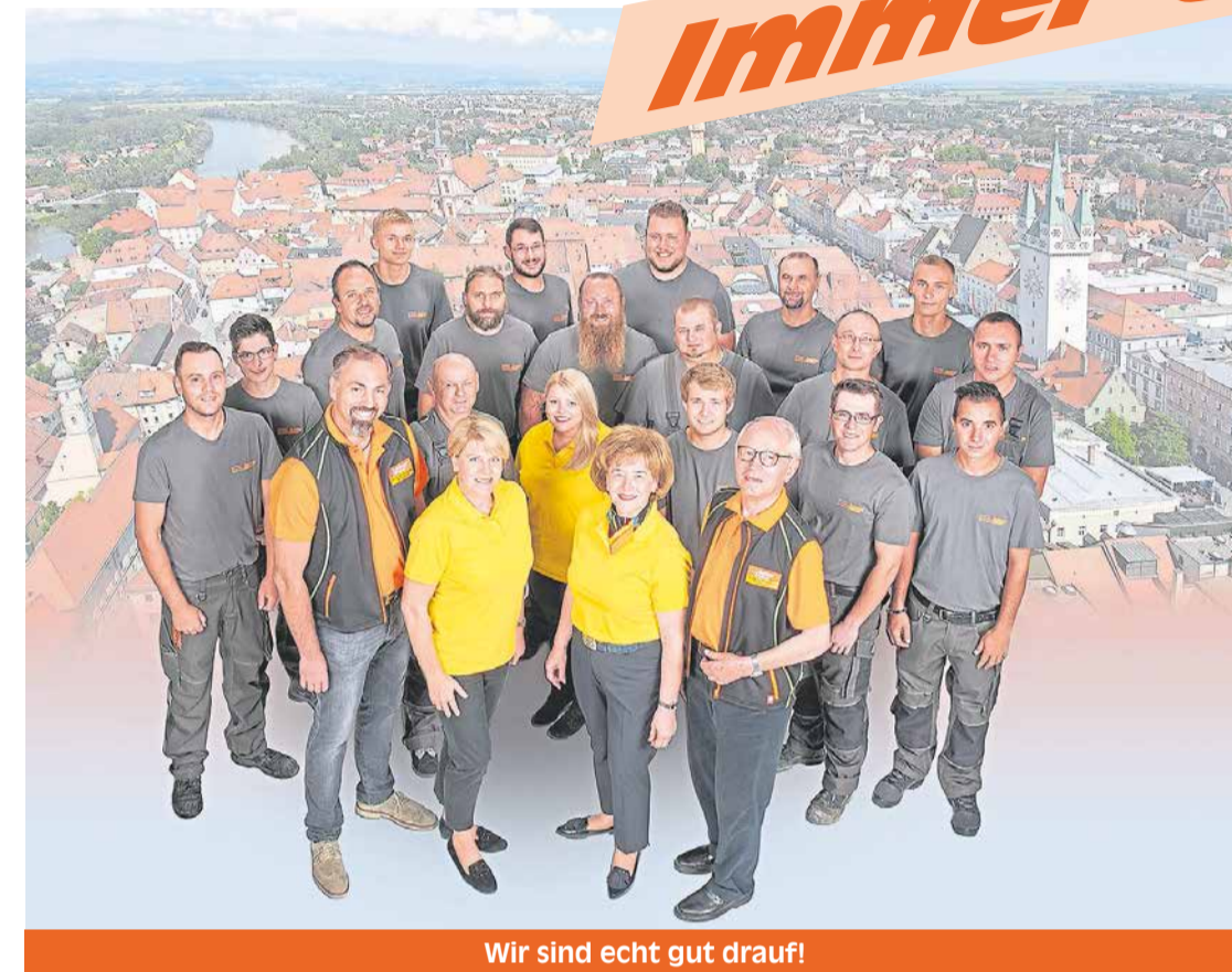
Wir sind echt gut drauf!

„Ob steil, ob flach, wir sind vom Fach“ mit diesem Slogan bietet der Dachdecker- und Bauspenglermeisterbetrieb nicht nur Arbeiten an Neubauten und Sanierungen von Steil- und Flachdächern an. Nach Aussage der Juniorchefs liegen die Kompetenzen des Weiteren in der Abdichtung von Tiefgaragen, Terrassen, Balkone, gegen aufsteigende Feuchtigkeit so-